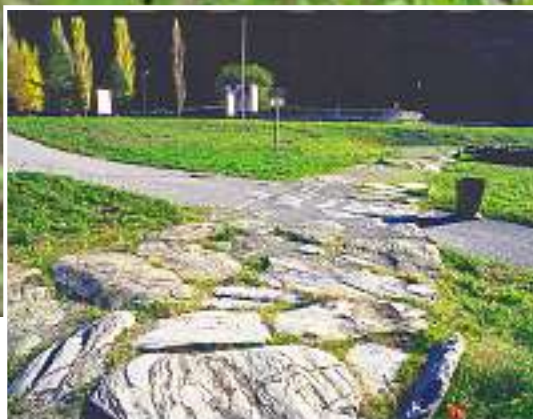
Les seuls vestiges de Suisse d'une route romaine pavée se trouvent à Martigny.