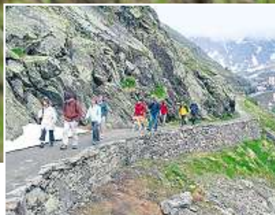
C'est au col du Grand-Saint-Bernard que les randonneurs quittent le territoire suisse.

La mode est aux vacances intelligentes et notre pays regorge d'itinéraires historiques. L'occasion de mieux connaître, lors d'une étape valaisanne, la Via Francigena reliant Canterbury à Rome. En route!