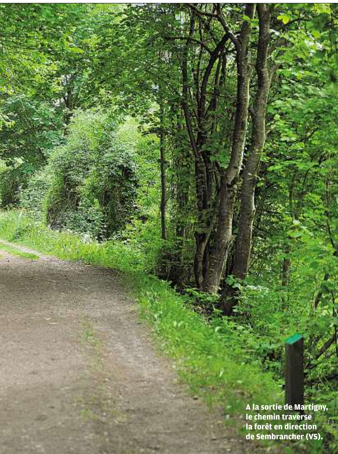
A la sortie de Martigny, le chemin traverse la forêt en direction de Sembrancher (VS).

l'Italie et la France. La boucle sera bouclée les 4 et 5 juillet prochain à Saint-Maurice. Une assemblée y réunira les responsables des quatre pays traversés pour la création officielle de l'Association européenne de la Via Francigena.